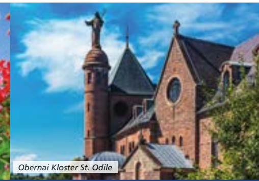
Obernai Kloster St. Odile