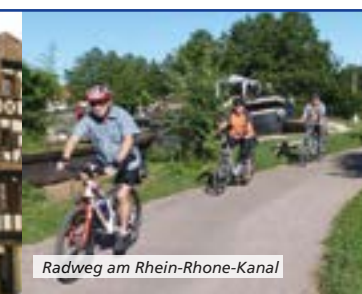
Radweg am Rhein-Rhone-Kanal