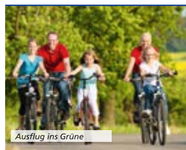
Ausflug ins Grüne

Place du Beffroi F-67210 Obernai T +33 (0) 388 956413 | F +33 (0) 388 499084 E info@tourisme-obernai.fr www.obernai.fr