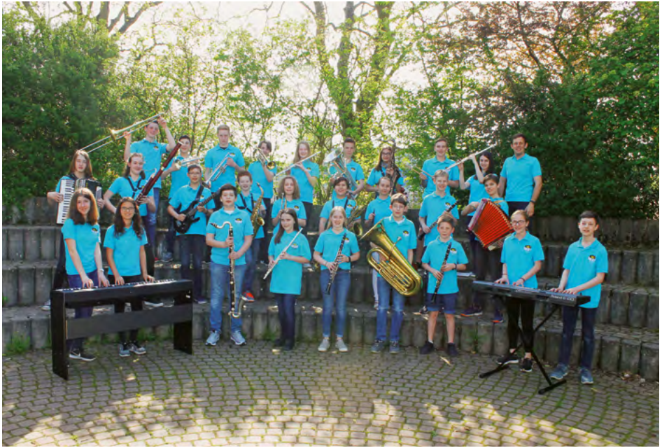
Musikklasse 7b des Carl-Friedrich-Gauß-Gymnasiums, Hockenheim