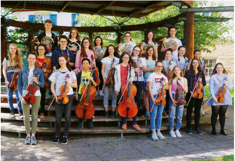
Orchester des Clara-Schumann-Gymnasiums, Lahr