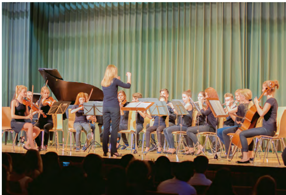
Schulorchester des Feudenheim-Gymnasiums, Mannheim