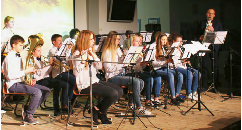
Schulband der Theodor-Heuss-Realschule, Offenburg