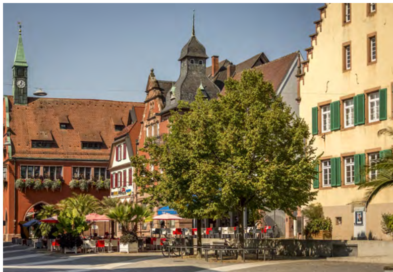
Altes Rathaus, Urteilsplatz