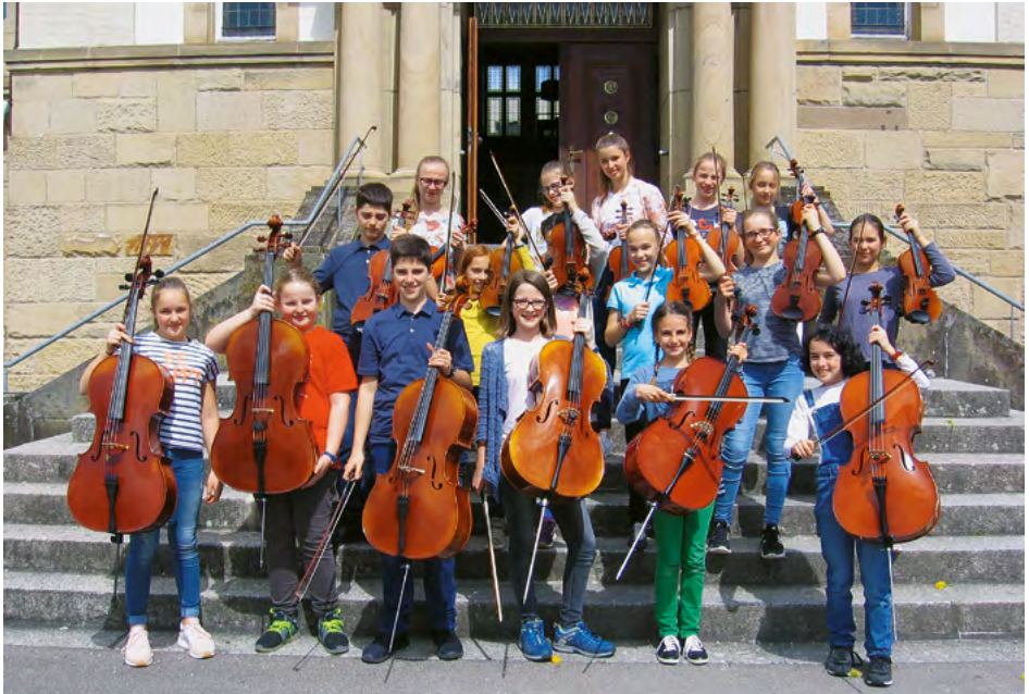
Unterstufenorchester des Clara-Schumann-Gymnasiums, Lahr