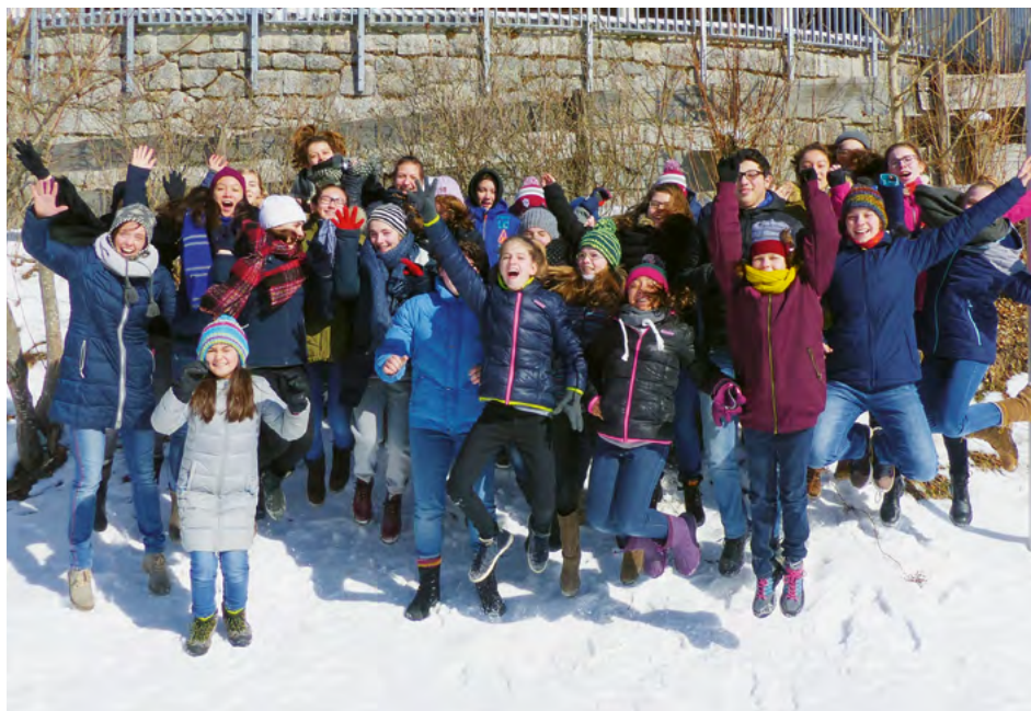
Orchester des Droste-Hülshoff-Gymnasiums, Freiburg