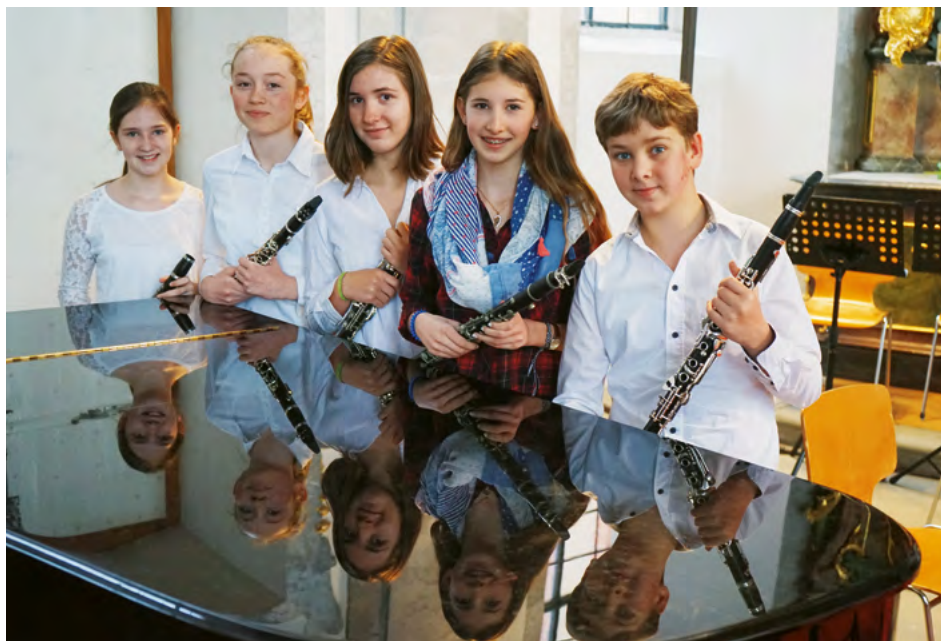
Klarinetten-Ensemble des Droste-Hülshoff-Gymnasiums, Meersburg