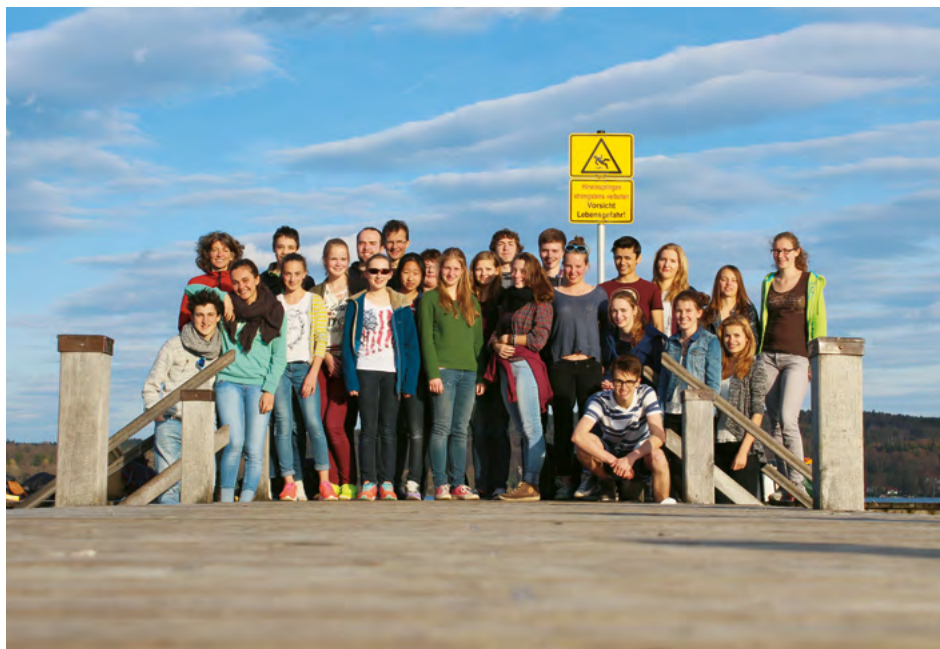
Sinfonieorchester des Uhland-Gymnasiums, Tübingen