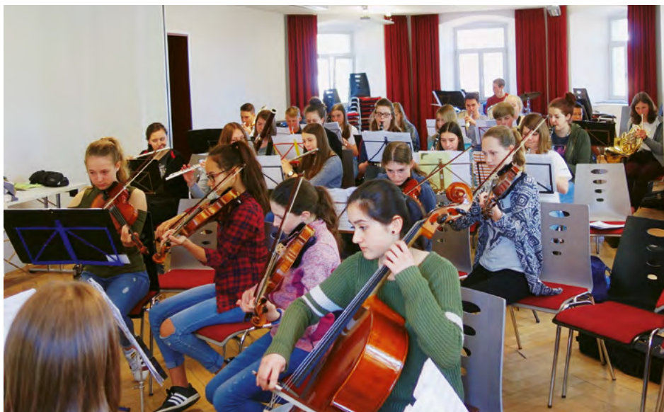
Gemeinsames Orchester des Droste-Hülshoff-Gymnasiums Rottweil & des Gymnasiums Trossingen