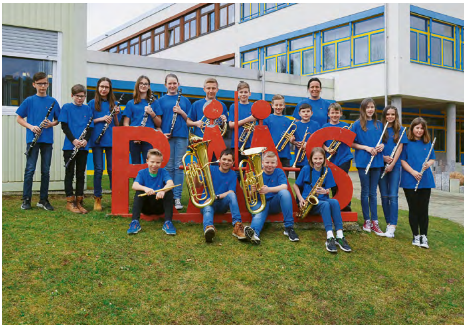
Bläserklasse der Rupert-Mayer-Realschule, Spaichingen