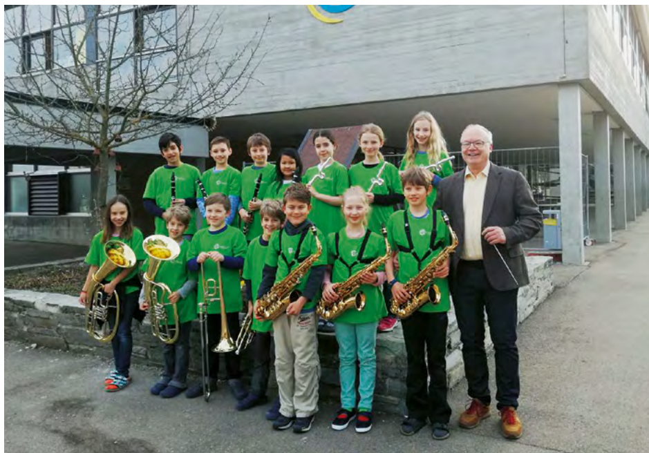
Klingensteiner Cool Kids der Eduard-Mörke-Grundschule, Blaustein