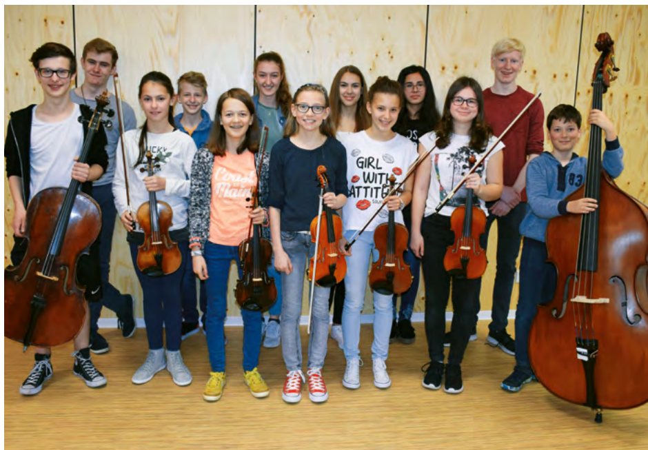
Streicher-AG des Gymnasiums Schramberg