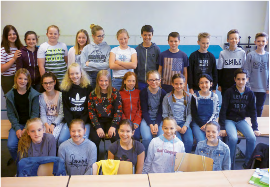
Klassenorchester 6a des Clara-Schumann-Gymnasiums, Lahr