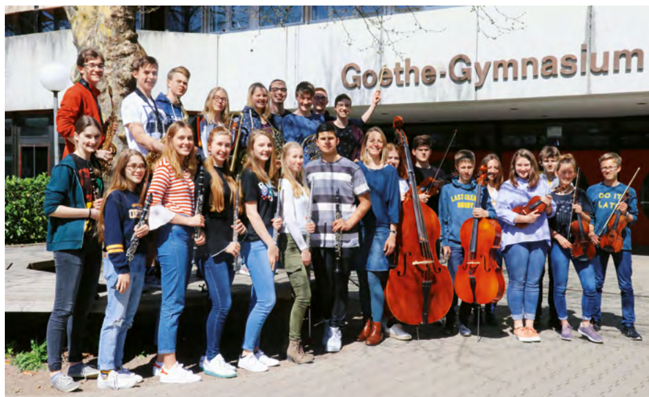
Orchester des Goethe-Gymnasiums, Emmendingen