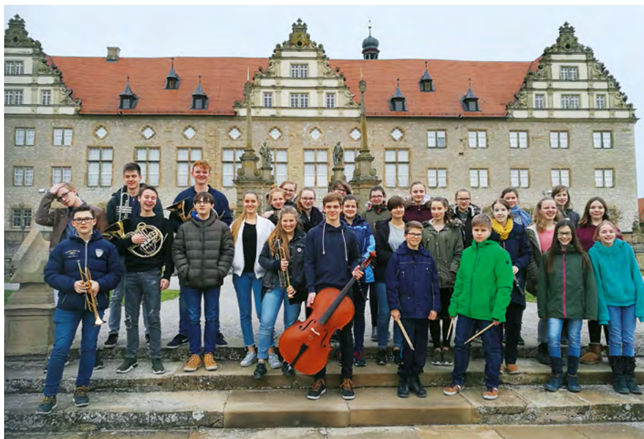
Schulorchester des Theodor-Heuss-Gymnasiums, Mühlacker