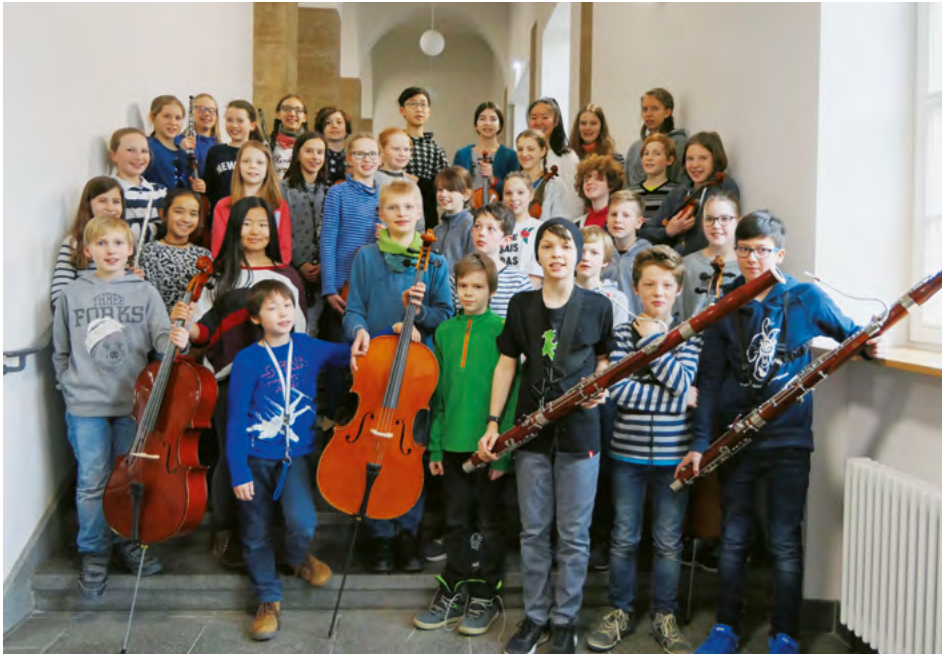
Junior-Orchester des Goethe-Gymnasiums, Ludwigsburg