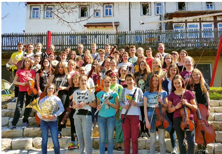
Profilorchester des Thomas-Strittmatter-Gymnasiums, St. Georgen