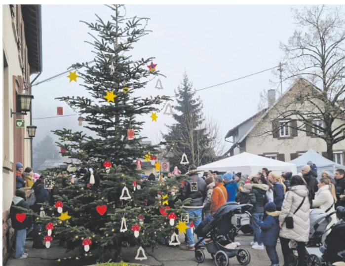
Dichtes Gedränge herrschte den ganzen Abend beim Weihnachtsmarkt rund um das Rathaus.