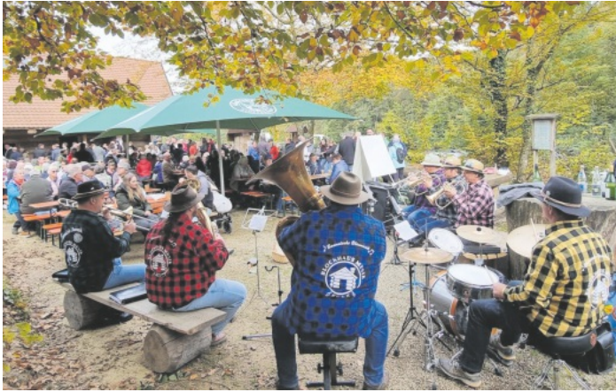
Musikfreunde aus Nah und Fern erfreuten sich an den musikalischen Klängen der heimischen Blockhausmusiker und den Sängern des MGV Schutterbund aus dem Schuttertal.