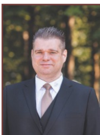
Michael Benz Beratungsgespräche

Ab 38 x 1/2 Hähnchen mit Pommes beliefern wir Sie mit unserem fahrbaren Imbisswagen!