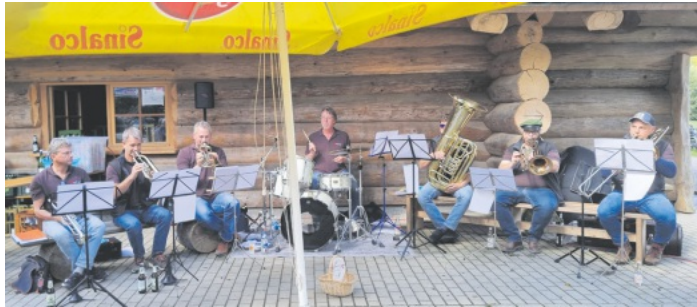
Rekordbesuch verbuchten die Veranstalter beim Frühschoppenkonzert mit der Formation „Blechbrägli“ am Sonntag beim Blockhaus im Sulzbachtal.

war wieder bestens gesorgt und dafür sorgte das Team vom neu gegründeten Blockhausteam. Bei bester Stimmung verrann die Zeit wie im Fluge und erst nach einigen Zugaben und dem „Badner Lied“ zum Abschluss, kehrte langsam wieder Stille im Sulzbachtal ein. Fazit der anwesenden Musikfreunde, es war wieder eine rundum gelungene Veranstaltung, die am 20. Oktober ab 11:00 Uhr mit der Blasmusikgruppe „Blockhausmusik“ seinen Saisonabschluss 2024 findet.