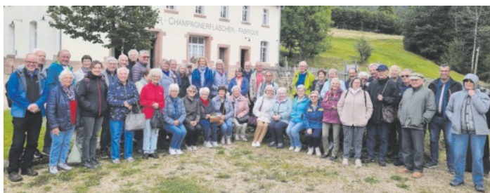
Recht zufrieden stellten sich die Sulzer Heimatfreunde vor die Glashütte Buhlbach zum Gruppenbild.

Nach einer kleinen Kaffeepause wurde dann wieder die Heimreise mit dem Busunternehmen Kaspar aus Oberharmersbach nach Sulz angetreten. Fazit bei den 50 Teilnehmern war, es war wieder einmal ein rundum gelungener Ausflug vom Förderverein Sulzer Heimatgut, der in allen Belangen viel an Wissenswertem einbrachte.