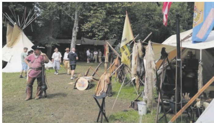
Reges Interesse herrschte am „Tag der offenen Türe“

„Vielleicht hat auch der ein oder andere Besucher Interesse an unserem Hobby gefunden. Wir freuen uns über jeden, der sich an einem unserer Sonntäglichen Frühschoppen Treffen einmal unverbindlich informieren möchte“, betonten die Winnebago Verantwortlichen. Infos über den Club findet man im Internet unter: www.indianerclub-lahr.de