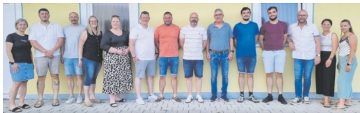
Der Gesamtvorstand des FV Sulz besteht jetzt aus insgesamt 19 Personen und kann somit sehr zuversichtlich in die weitere Zukunft blicken.