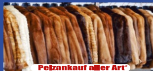
Pelzankauf aller Art