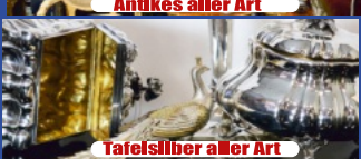
Tafelsilber aller Art