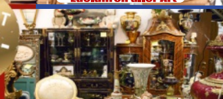
Antikes aller Art