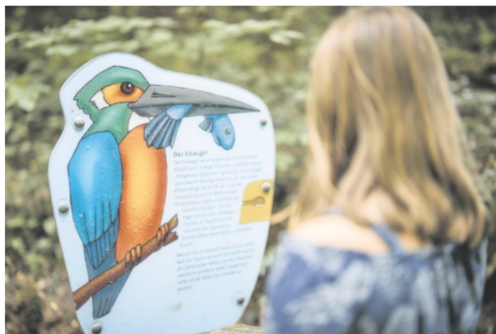
Bild: Einblicke in die Natur und Tierwelt bietet der Wasserpfad im Sulzbachtal.