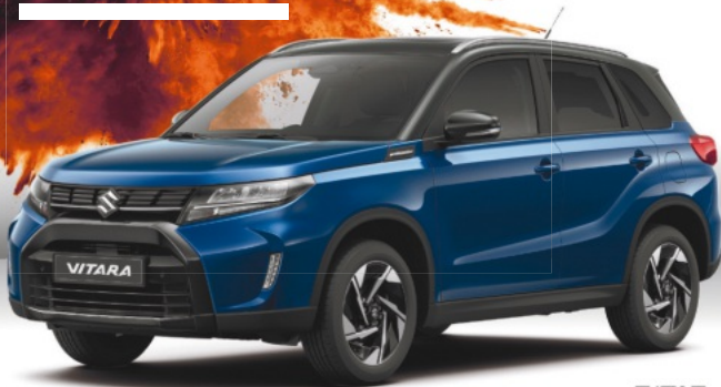
Abbildung zeigt aufpreispflichtige Sonderausstattung. Mehr Informationen zu Ausstattungslinie und Sonderausstattungen finden Sie hier: