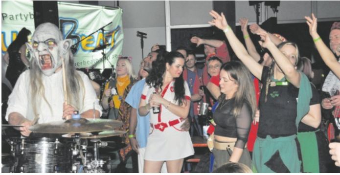
Die Guggenmusiker Ruienenschlufer aus Lahr sorgten mit ihren Masken eine recht schaurige Stimmung in der Sulzberghalle