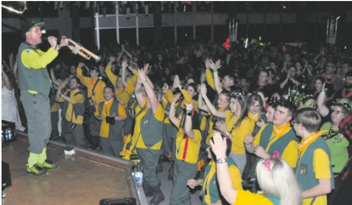
Für Stimmung pur sorgte die Knallfroschkombo aus Weier unter den Narren im bis auf den letzten Platz belegten Kulturhalle