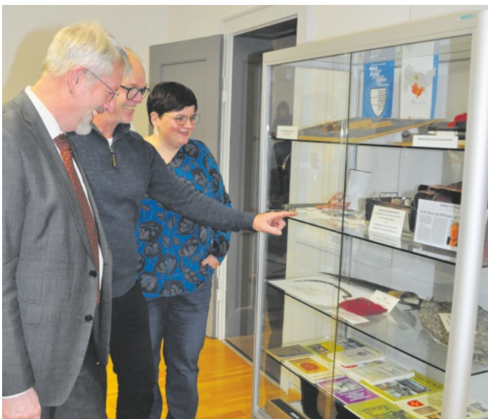
Viel zu Bestaunen gab es bei der Ausstellung anlässlich der neuen Vitruven, wobei neben einer Keltischen Sichel auch ein Mahlstein aus dem Mittelalter das Interesse der Besucher weckte.

Auch kulinarisch wird es neben Fleischkäse und Schnitzelweckle einen Stand mit Käsespätzle, Fischbrötchen und Bratwurst geben. Die Gäste können sich somit auf beste Fasents