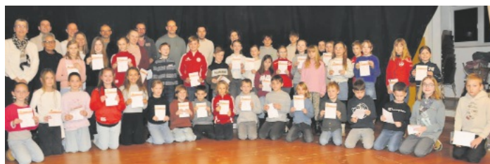
Mit 101 Teilnehmern am deutschen Sportabzeichen in Gold, Silber und Bronze konnten die Verantwortlichen des TV Sulz einen neuen Rekord vermelden.