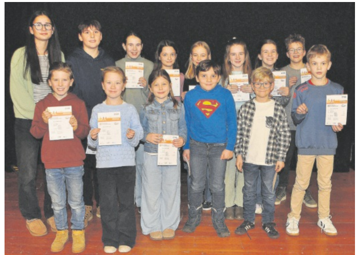
Gleich 68 Teilnehmer aus allen Altersgruppen erreichten eine Auszeichnung beim Deutschen Sportabzeichen.