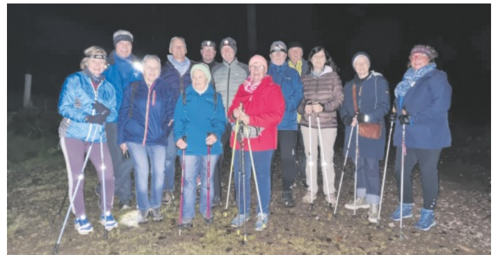
Nordic-Walking-Lauftreff - Nachtwanderung SWV 12.11.2024

Infos: www.schwarzwaldverein-reichenbach.de