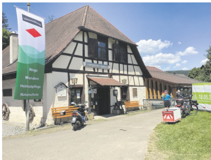
Hammerschmiede Reichenbach - Schwarzwaldverein Reichenbach e.V.