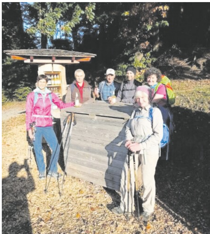
140. traditionelle Kartoffelsalat-Wanderung am 13.10.2024

Bei vollkommener Dunkelheit starten wir um 5:00 Uhr am Lindenplatz.