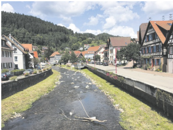
Naturpark Augenblickrunde Schiltach-Schlossberg - Schwarzwaldverein Reichenbach e.V. - Wanderung am Sonntag, 28. September 2025 - Wanderführerin: Stephanie Pfeiffer

Infos: www.schwarzwaldverein-reichenbach.de