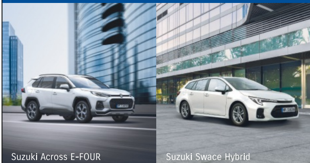
Suzuki Across E-FOUR