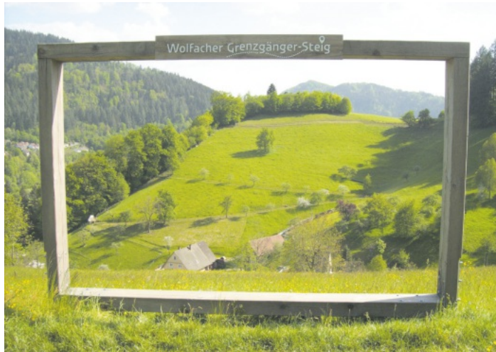
Wolfacher Grenzgänger-Steig SWV Reichenbach e.V.