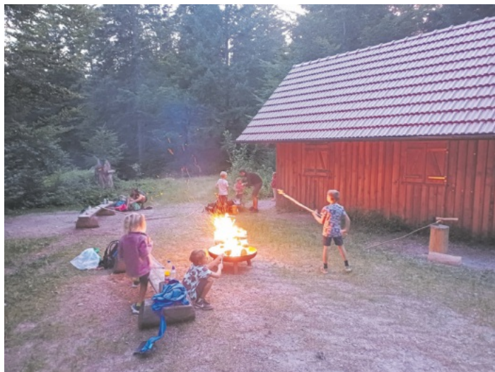
Die Nacht im schwarzen Wald - Familiengruppe im Schwarzwaldverein Reichenbach e.V. - Florian Niedermaier - 12. bis 13. Juli 2025