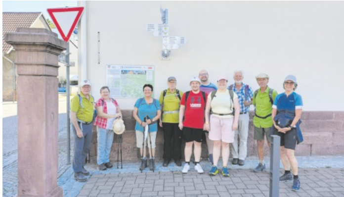
Wandergruppe auf dem christlich-jüdischen Kulturweg 14. Juli 2024