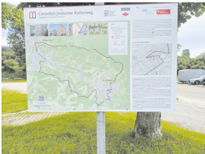
Christlich-jüdischer Kulturweg 14. Juli 2024

Gäste sind zu allen Veranstaltungen herzlich willkommen! Infos: www.schwarzwaldverein-reichenbach.de