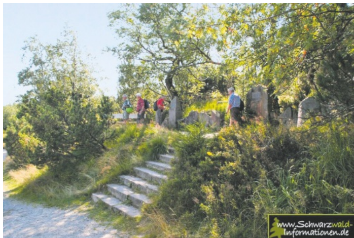
Auf den Wegen des Julius Euting - Schwarzwaldverein Reichenbach e.V. mit Wanderführer Klaus-Herbert Jung - Samstag, 11. Juli 2026

Fahrtkosten: ca. 6 bis 9 € pro Person Gehzeit: ca. 4,5 Stunden, 14 km, 500 hm auf Treffpunkt: 9:30 Uhr Lahr-Bahnhof mit Rucksackverpflegung Einkehrmöglichkeiten: Darmstädter Hütte oder Rasthütte Seibelseckle Gäste sind herzlich willkommen Anmeldung: bis Donnerstag, 09. Juli 2026 erforderlich zur Ermittlung der benötigten Fahrkarten mail: wandernundwege@schwarzwaldverein-reichenbach.de Wanderführer: Klaus-Herbert Jung, Schwarzwaldverein Reichenbach e. V. Infos: www.schwarzwaldverein-reichenbach.de