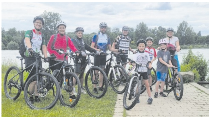
Familiengruppe im Schwarzwaldverein Reichenbach e.V.

Nach 75 Kilometer und über 11 Stunden „auf Tour“ hatten wir uns das alle verdient.