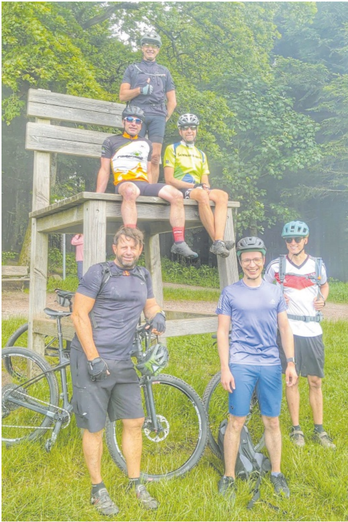
MTB-Tour Schwarzwaldverein Reichenbach e.V. 16. Juni 2024