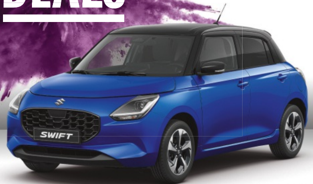
Abbildung zeigt aufpreispflichtige Sonderausstattung. Mehr Informationen zu Ausstattungslinie und Sonderausstattungen finden Sie hier: