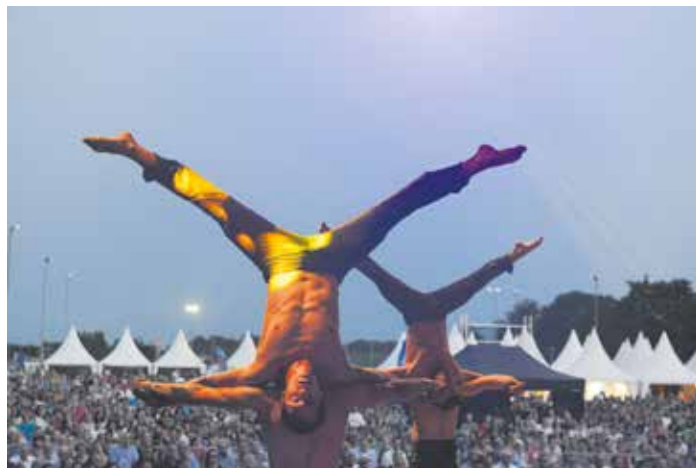
Das Landesturnfest 2022 beginnt am 25. Mai mit einer sportlich-bunten Eröffnungsshow im Lahrer Seepark – getreu dem Turnfest-Motto: „Da turnt sich was zusammen!“

Weitere Infos und das vollständige Programm gibt es unter www.landesturnfest.de .