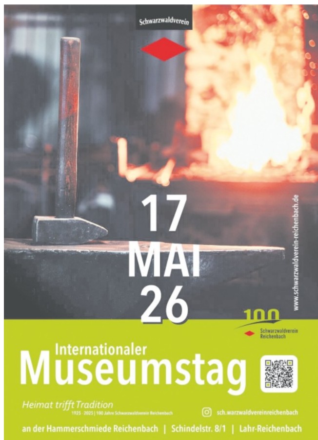
Internationaler Museumstag beim Schwarzwaldverein Reichenbach e.V. an der Hammerschmiede Reichenbach am Sonntag, 17. Mai 2026 von 11:00 Uhr bis 18:00 Uhr