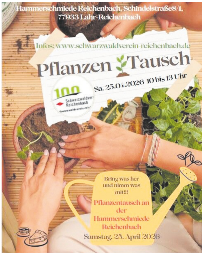
Pflanzentausch an der Hammerschmiede Reichenbach / Schwarzwaldverein Reichenbach e.V. am Samstag, 25. April 2026 10:00 bis 13:00 Uhr