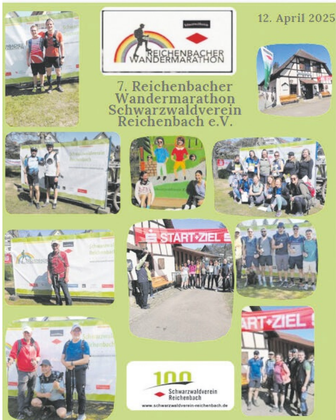
Impressionen vom 7. Reichenbacher Wandermarathon im Schwarzwaldverein Reichenbach e.V. am 12. April 2025