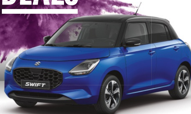
Abbildung zeigt aufpreispflichtige Sonderausstattung. Mehr Informationen zu Ausstattungslinie und Sonderausstattungen finden Sie hier: