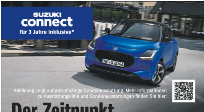
Abbildung zeigt aufpreispflichtige Sonderausstattung. Mehr Informationen zu Ausstattungslinie und Sonderausstattungen finden Sie hier.