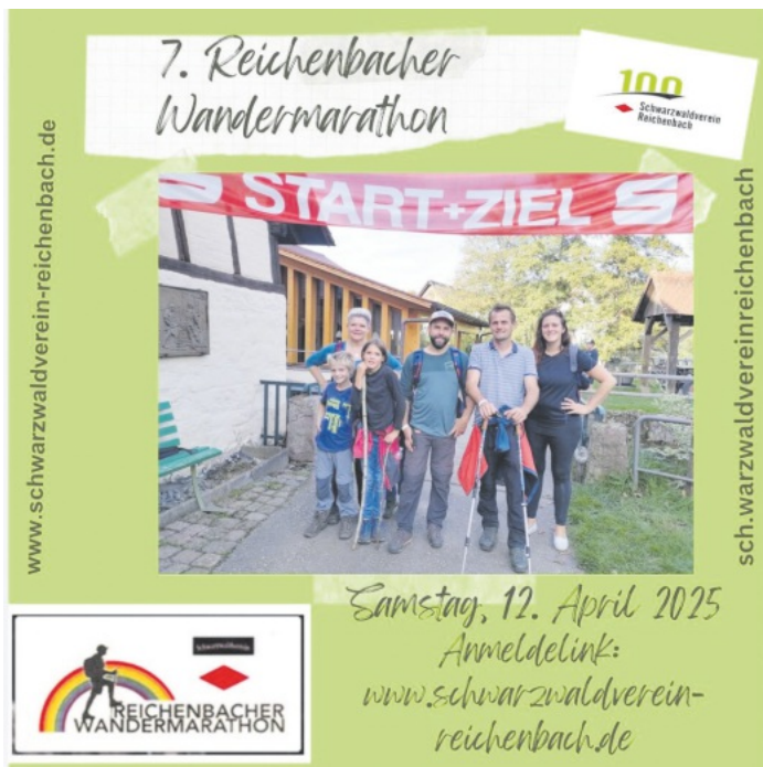
7. Reichenbacher Wandermarathon Schwarzwaldverein Reichenbach e.V.