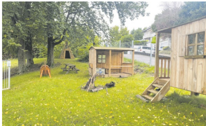
Abenteuer-Spielstationen in der Kita Schießrain

Seit dem ersten Durchlauf 2019 haben die Lahrerinnen und Lahrer 280 Ideen eingebracht, von denen 131 zur Abstimmung gestellt werden konnten. In den letzten drei Durchläufen gab es insgesamt 37 Gewinnerprojekte, von denen schon 34 erfolgreich umgesetzt werden konnten. Lediglich eines davon wurde von den Ideengebern zurückgezogen.