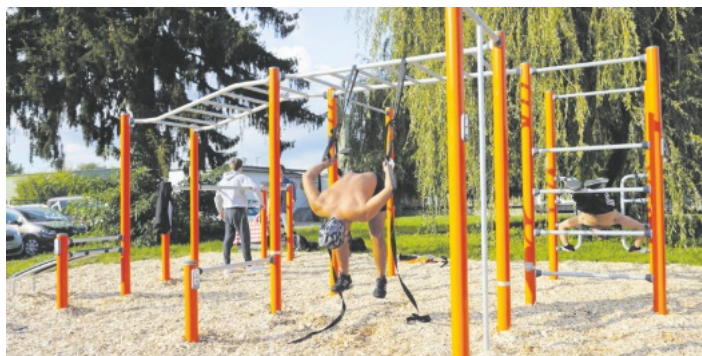
Zwei Männer trainieren an der neuen Calisthenics-Anlage.

Dienstag + Mittwoch 10 – 17 Uhr / Donnerstag 10 – 18 Uhr / Freitag + Samstag 10 – 13 Uhr