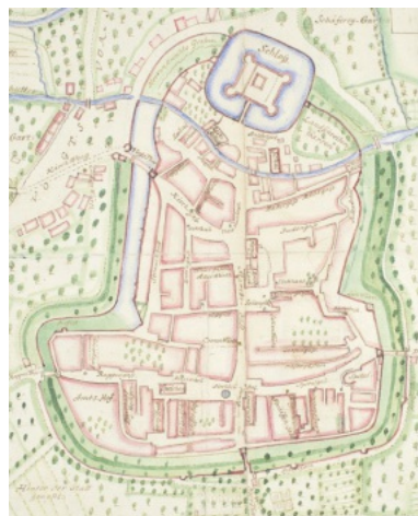
Ausschnitt Plan Mietersheim