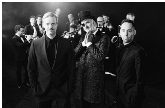
Moka Efti Orchestra

VVK: 30–35 € / Wer im 1920er Look kommt, erhält ein Glas Sekt gratis (mit oder ohne Alkohol).