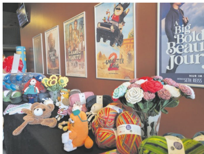
Blumen aus Wolle und Kinoplakate im Hintergrund

Der Eintritt kostet 7,90 €. Tickets gibt es über www.forumcinemas.de oder an der Kinokasse des Forum Kinos Lahr.