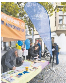
Bild der letztjährigen Veranstaltung vom 27.09.2025 in Lahr