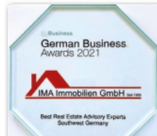
IMA Immobilien wurde als Bester Makler in Südwestdeutschland ausgezeichnet.