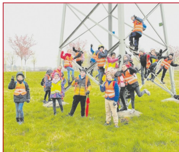
Die Klasse 3 der Grundschule Mietersheim bei der Kreisputzete 2022.

Die Ortsvorsteherin, der Ortschaftsrat und die Ortsverwaltung sind begeistert von der Einsatzbereitschaft und bedanken sich vielmals!