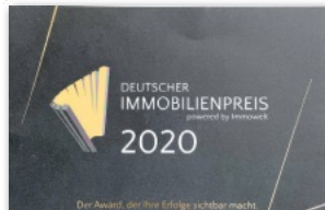
Verschiedene Auszeichnungen machen den Erfolg von IMA Immobilien sichtbar, hier vom Portal Immowelt.