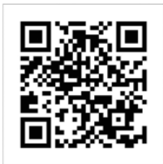
AbfallApp des Landratsamtes Ortenaukreis.

Weitere Auskünfte rund um das Thema Abfall gibt es bei den Abfallberatern des Eigenbetriebs Abfallwirtschaft Ortenaukreis unter Telefon 0781 805-9600 und per E-Mail an abfallwirtschaft@ortenaukreis.de .