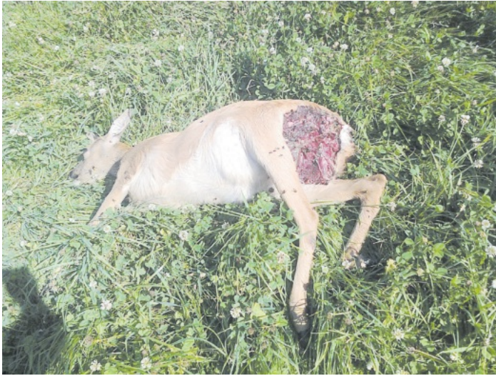
Aufgrund von Hundebissen verendetes Reh auf Lahrer Gemarkung.