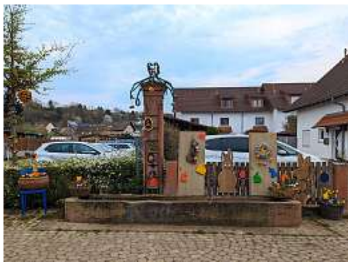
Osterbrunnen in Mietersheim

Wir möchten uns ganz herzlich beim Verein der Haus- und Gartenfreunde für das wundervolle und aufwendige Schmücken rund um den Brunnen in der Mietersheimer Hauptstraße zur Osterzeit bedanken!