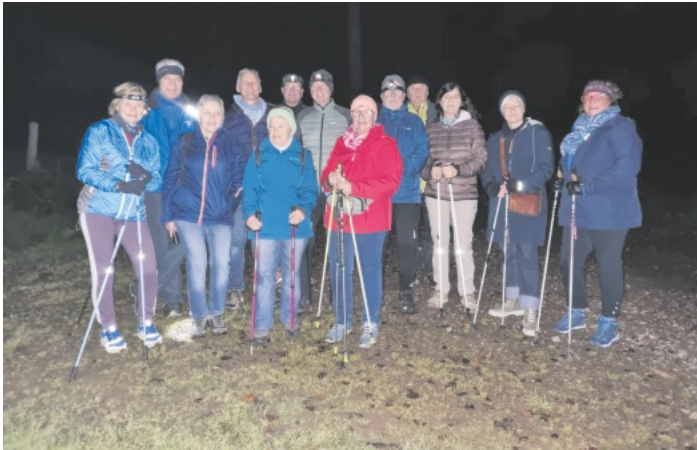
Nachtwanderung SWV-Nordic-Walking-Lauftreff am 12. November 2024

Gäste sind zu allen Veranstaltungen herzlich willkommen! Infos: www.schwarzwaldverein-reichenbach.de