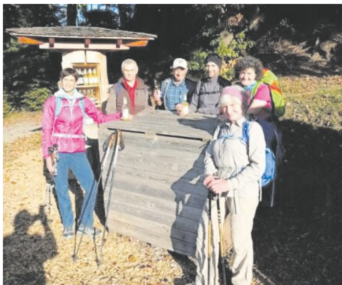
140. Traditionelle Kartoffelsalatwanderung am 13.10.2024