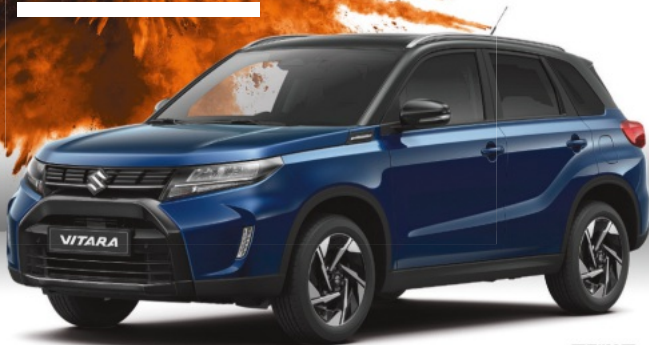
Abbildung zeigt aufpreispflichtige Sonderausstattung. Mehr Informationen zu Ausstattungslinie und Sonderausstattungen finden Sie hier: