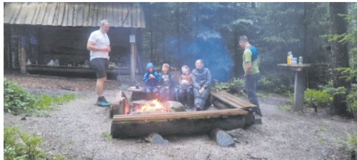
Familiengruppe Nacht im schwarzen Wald 6. Juli bis 7. Juli 2024

Michelsbrunnen, an dem die Morgenwäsche inkl. Zähneputzen durchgeführt wurde. Die letzten Meter zum Aussichtsturm fühlten sich aufgrund des vielen Niederschlags wie eine „Wattwanderung“ an, meinten manche Teilnehmenden. Beim weiteren Weg zum „Lothar-Denkmal“ hatten wir noch ein besonderes Erlebnis: eine ganze Rote Wildschweine kreuzte unseren Weg. Am Denkmal pausierten wir nochmals kurz, um die Aussicht wirken zu lassen. Anschließend ging es über einen kleinen verwilderten Weg zurück zur Kornebene, wo wir eine verspätete Mittagsrast machten. Trotz der 7,5 km und 250 hm brauchten die Kinder keine Pause, sondern tobten auf dem Spielplatz weiter. Der Rückweg zum Parkplatz war dann nur noch ein „Klacks“.