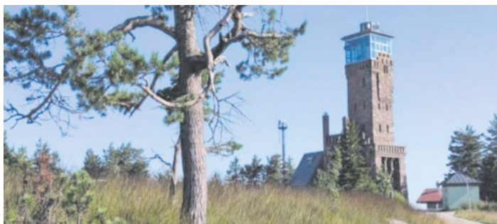
MTB-Tour im Schwarzwaldverein Reichenbach e.V. mit MTB-Tourguide Dieter Buhlinger am Sonntag, 6. Juli 2025

Das Tragen eines Helms zum eigenen Schutz ist obligatorisch. Da die Runde hauptsächlich über Wald und Schotterwege führt, muss das MTB hierfür geeignet sein