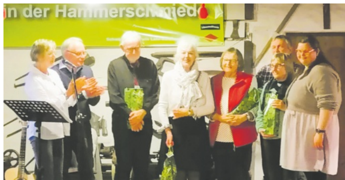
Lahrer Murre an der Hammerschmiede Reichenbach 1. Juni 2024