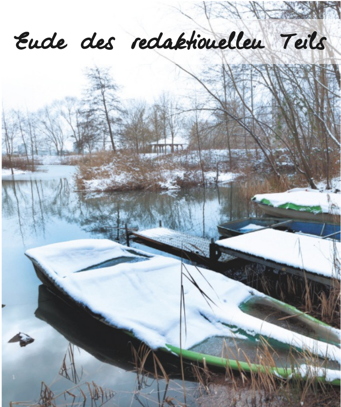
Ende des redaktionellen Teils

Anträge zu Punkt 6 sind bis Freitag, 14.03.2025 an poststelle@gs-lahr-rb.schule.bwl.de zu richten.