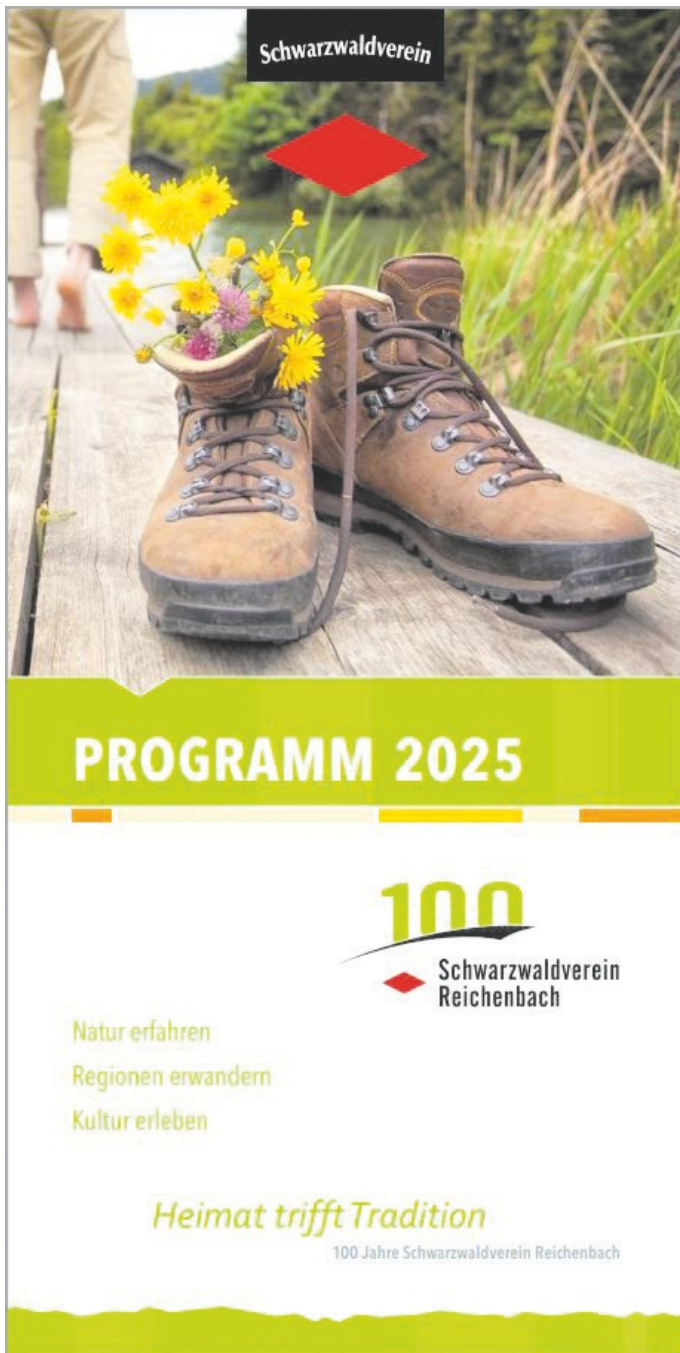
Jahresprogramm Schwarzwaldverein Reichenbach e.V. 2025- Titelseite